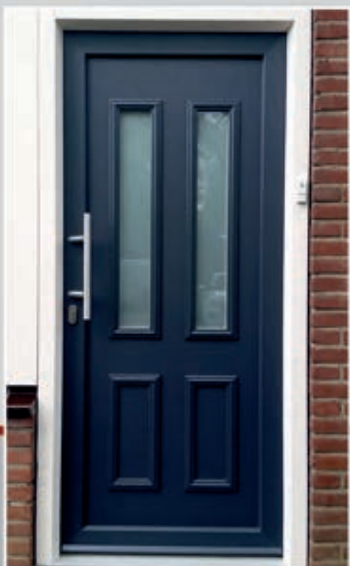
K.40 | Ibicella II • Glas: Satinato