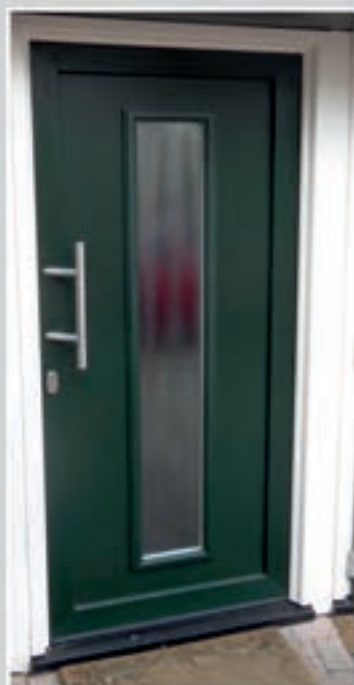
K.45 | Iberis • Glas: Chinchilla blank