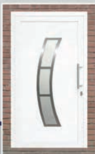
S.26 | Boge • Glas: Satinato • Applicaties en ornament in Alunox-RVS-look