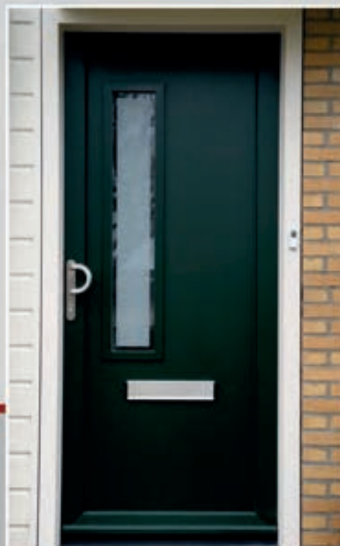
K.42 | Calluna - links