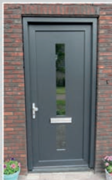
T.139 | Hedera • Glas: Helder • Glas ingefreesd