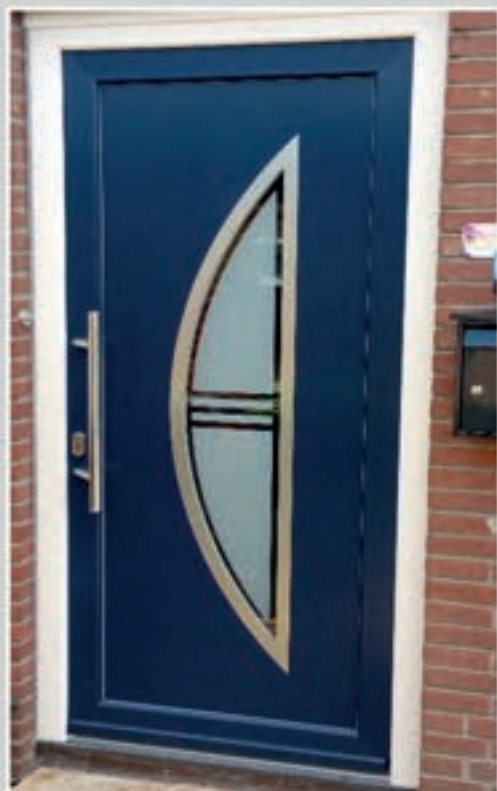
S.20 | Kurkuma II • Matglas met heldere rand en strepen • Ornamenten in Alunox-RVS-look