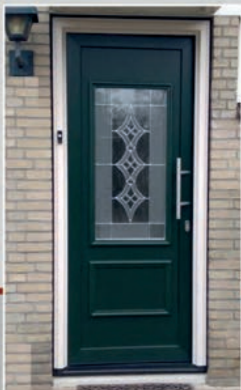
K.63 | Maranta • Glas in lood