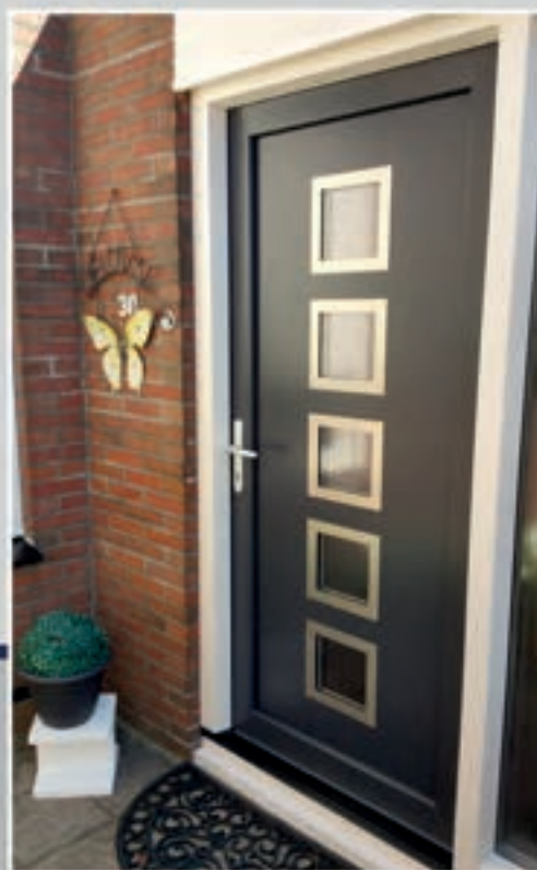
S.19 | Canarissa • Glas: Master Carré = meerprijs • Ornamenten in Alunox-RVS-lock