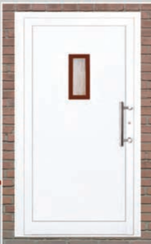
K.46 | Lombok 220 • Glas: Satinato