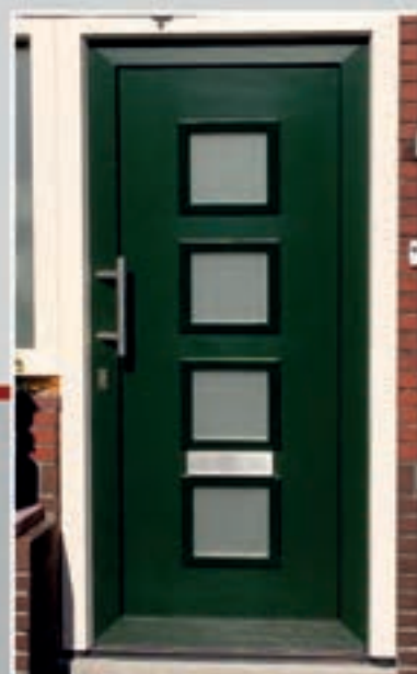
K.31 | Canaria • Glas: Satinato