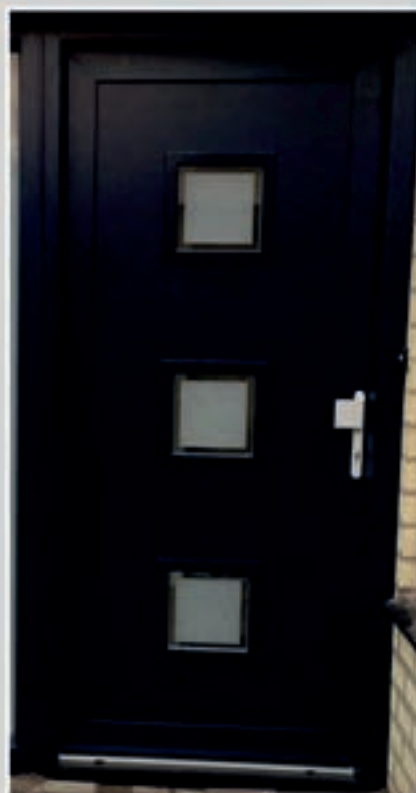
K.71 | Juna • Matglas met heldere rand = meerprijs