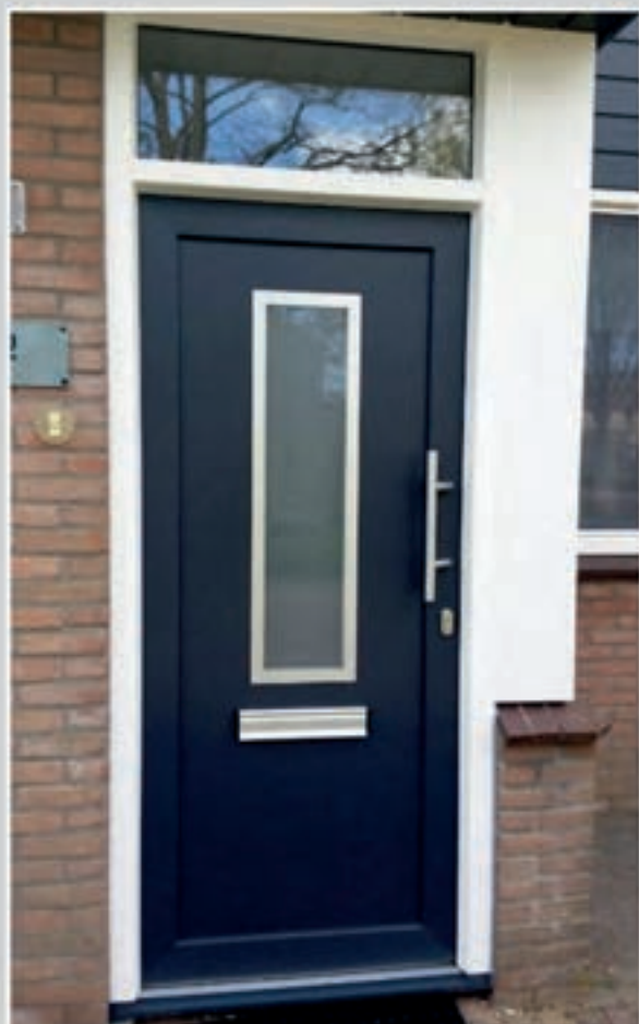
S.24 | Calluna • Glas: Satinato • Ornament in Alunox-RVS-look