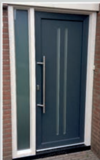
T.07 | Saffron • Glas: Satinato • Glas ingefreesd