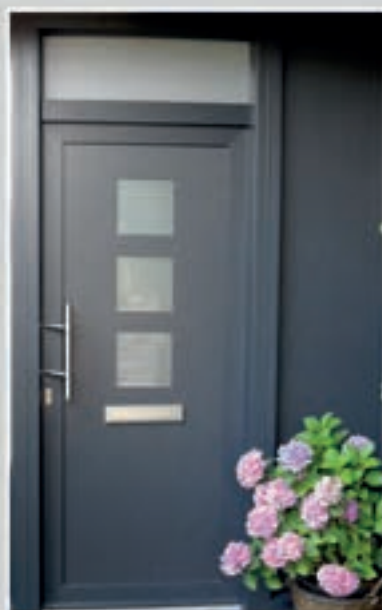
T.118 | Canela • Glas: Satinato • Glas ingefreesd