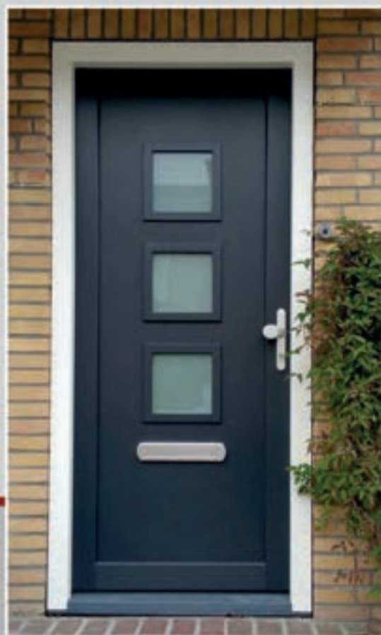
K.57 | Canela • Glas: Satinato