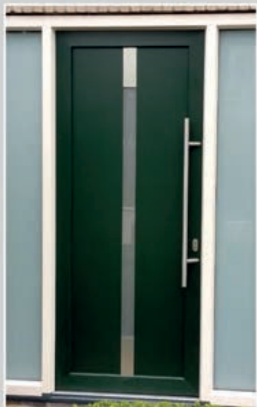
S.09 | Maya II • Glas: Satinato • Applicaties in Alunox-RVS-look