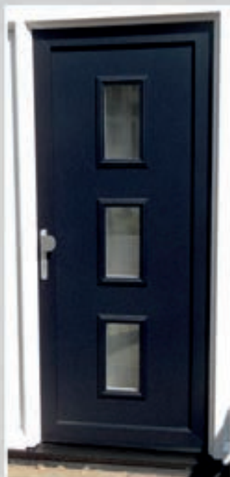
K.41 | Campanula • Glas: Helder • Zonder brievenbus