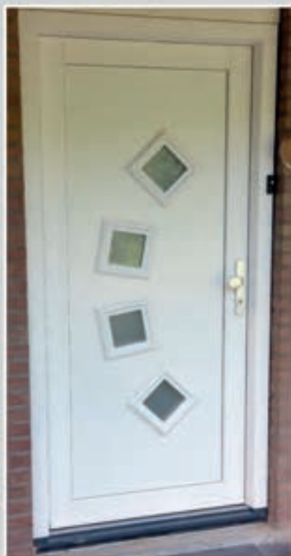
K.30 | Tomillo • Glas: Satinato

Klassieke ornamenten zijn bij de standaard kleuren voorzien van structuurlak, tenzij anders vermeld bij de foto's.