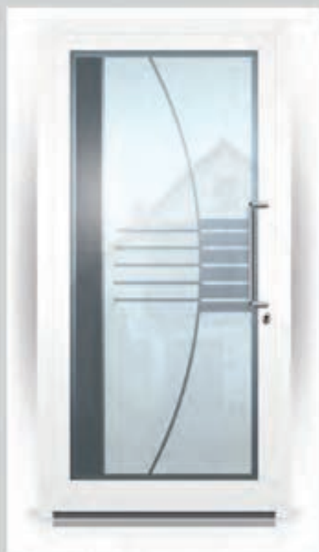
G.901 | Da Capo • In 2 tinten gezandstraald glas met heldere motieven

Glaspanelen kunnen alleen uitgevoerd worden in totale dikte van 28 mm of 36 mm. Standaard voorzien van Veiligheidsglas aan de binnen- en buitenzijde!!! Donkere kleur glas is gelijkend RAL 7013.