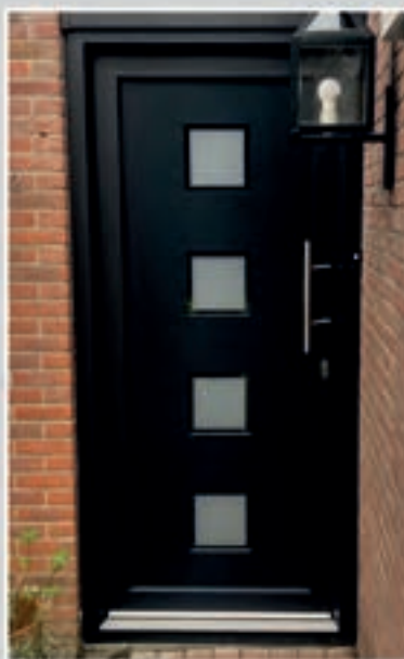
T.02 | Canna