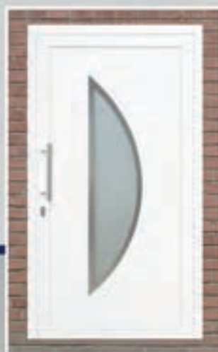
S.27 | Kurkuma • Glas: Satinato • Ornament in Alunox-RVS-look