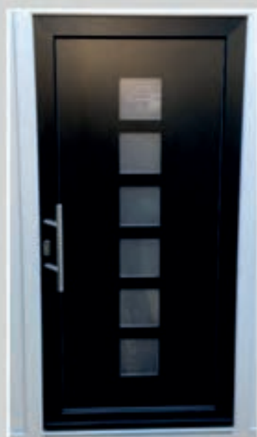
T.04 | Camassia • Glas: Satinato • Glas ingefreesd