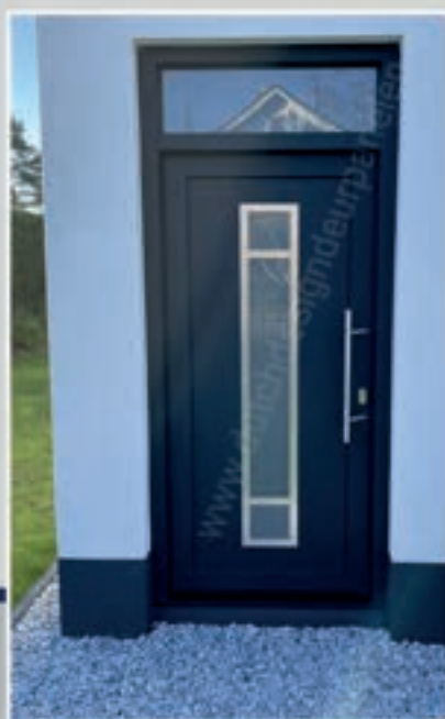
S.12 | Iberis II • Glas: Satinato • Applicaties in Alunox-RVS-look