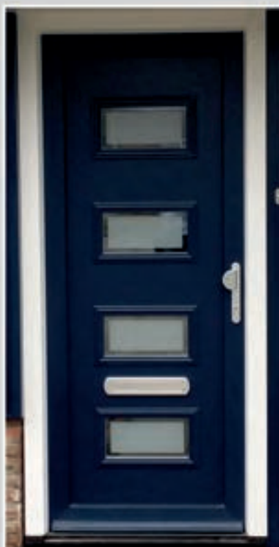
K.56 | Damiana • Matglas met heldere rand = meerprijs