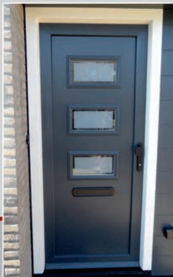
K.161 | Adonis • Matglas met heldere rand = meerprijs