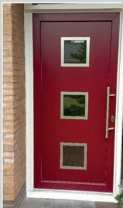
S.17 | Juna • Glas: Helder • Ornamenten in Alunox-RVS-lock