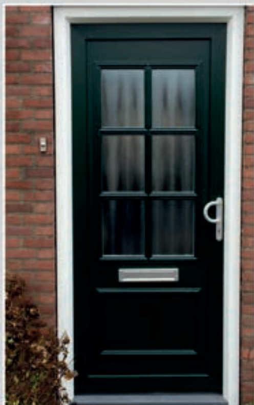
K.72 | Digifalls • Glas: Chinchilla blank