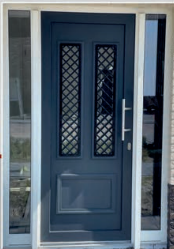
K.189 | Galantus