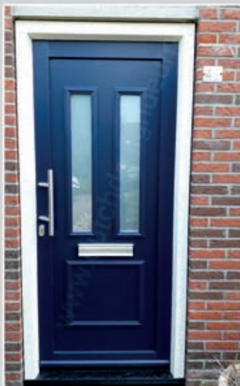
K.39 | Ibicella I • Glas: Satinato