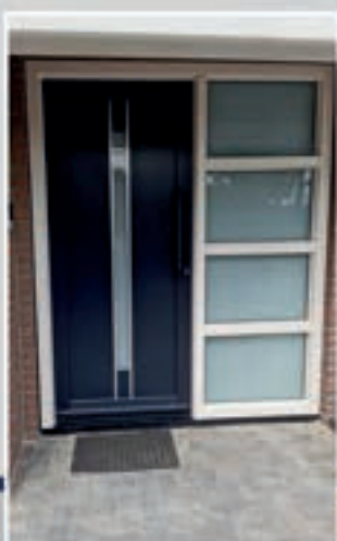
S.81 | Damaris • Glas: Satinato • Applicaties in Alunox-RVS-look