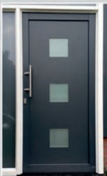
T.05 | Juna