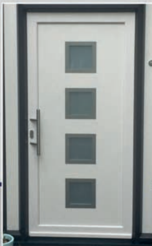
S.86 | Canna • Glas: Satinato • Ornamenten in Alunox-RVS-lock