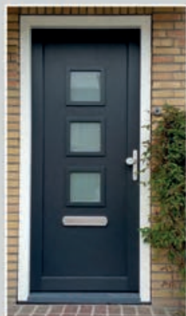
K.57 | Canela • Glas: Satinato