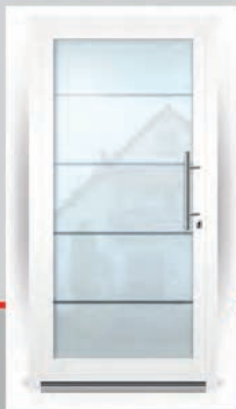
G.904 | Purist • Gezandstraald glas met heldere motieven