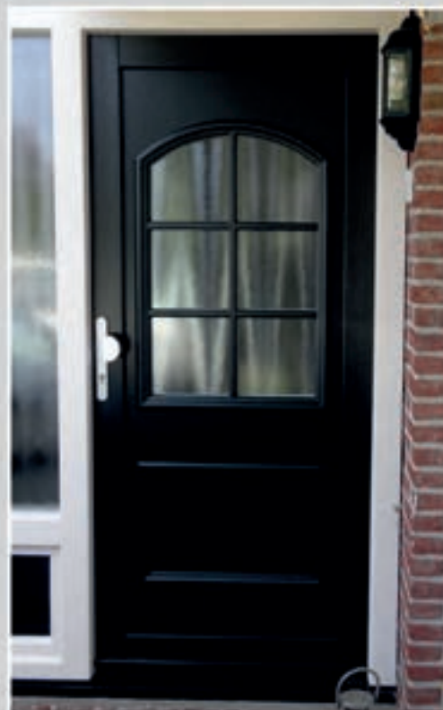
K.62 | Lotus