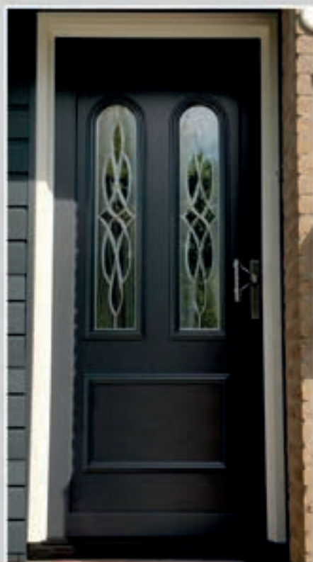
K.34 | Gerbera I • Glas in lood • Bultengreep niet leverbaar