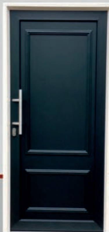
K.47 | Maranta gesloten • Dicht model