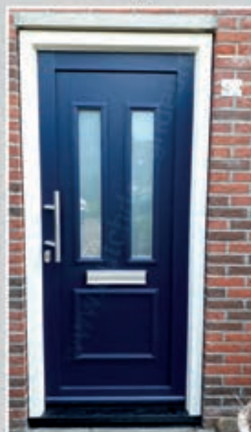
K.39 | Ibicella I • Glas: Satinato