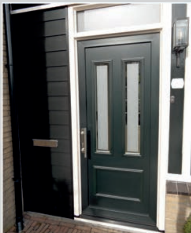
K.120 | Rosea • Matglas met heldere rand = meerprijs