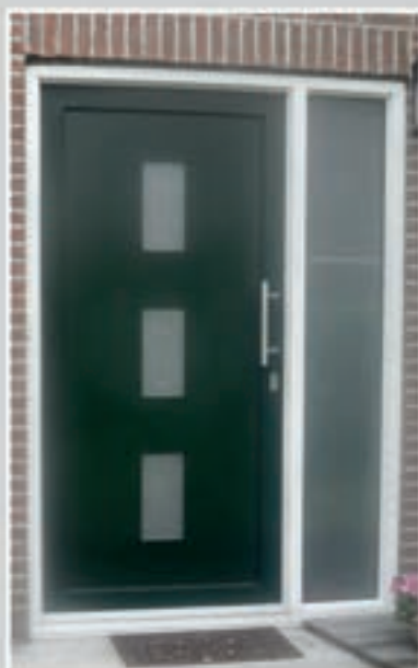
T.91 | Campanula • Glas: Satinato • Glas ingefreesd