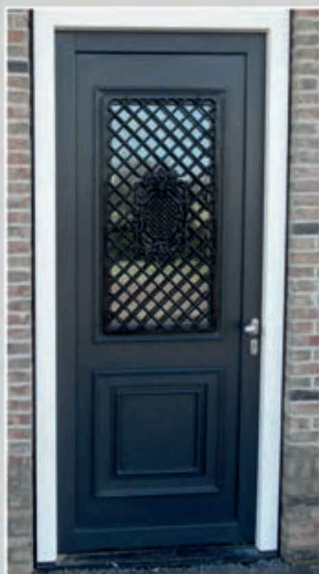
K.59 | Rubin met Sierrooster