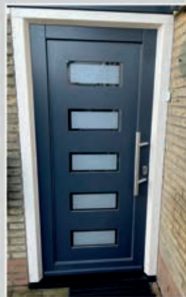
T.03 | Tema