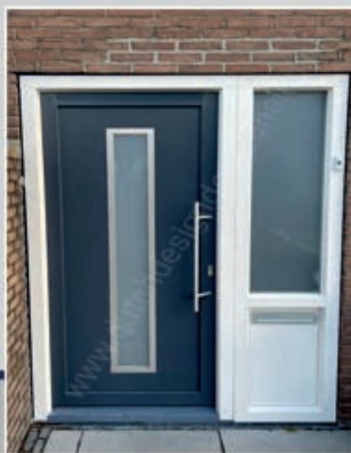
S.14 | Iberis • Glas: Satinato • Ornament in Alunox-RVS-look