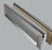
Brievenbus DDD I (Ami)