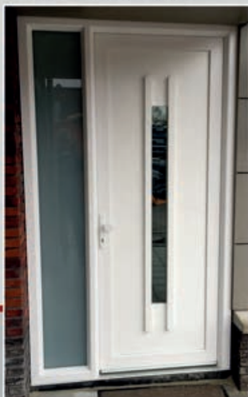
K.160 | Amni - XL