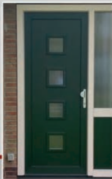
K.32 | Canna • Glas: Chinchilla blank