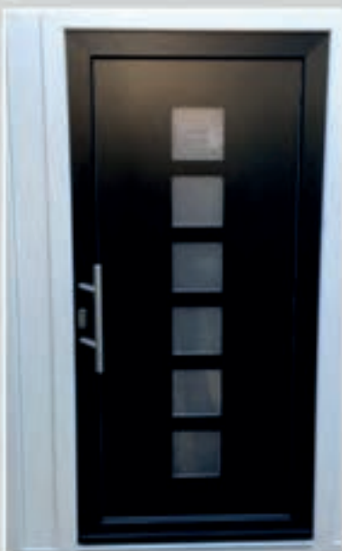
T.04 | Camassia