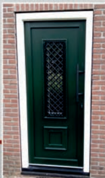
K.101 | Sabrosa met sierrooster Uitermate geschikt voor smalle en minder hoge deuren!