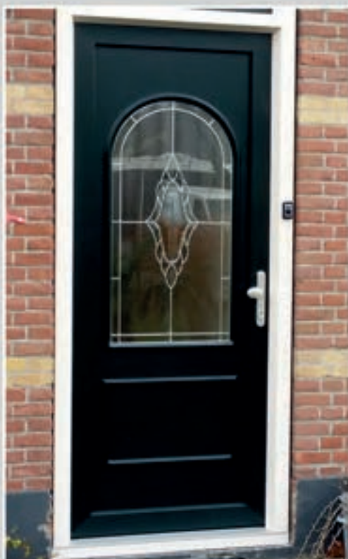
K.35 | Hortensie • Glas in lood