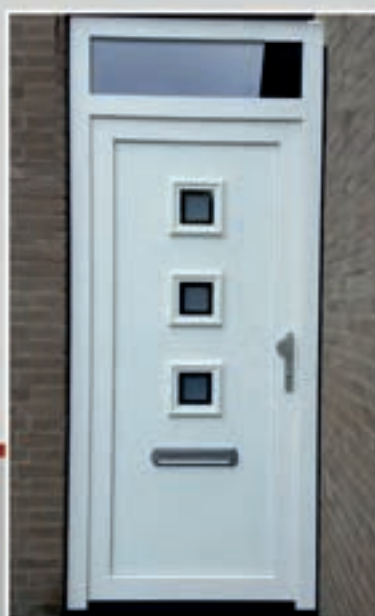
K.82 | Viola • Matglas met heldere rand = meerprijs