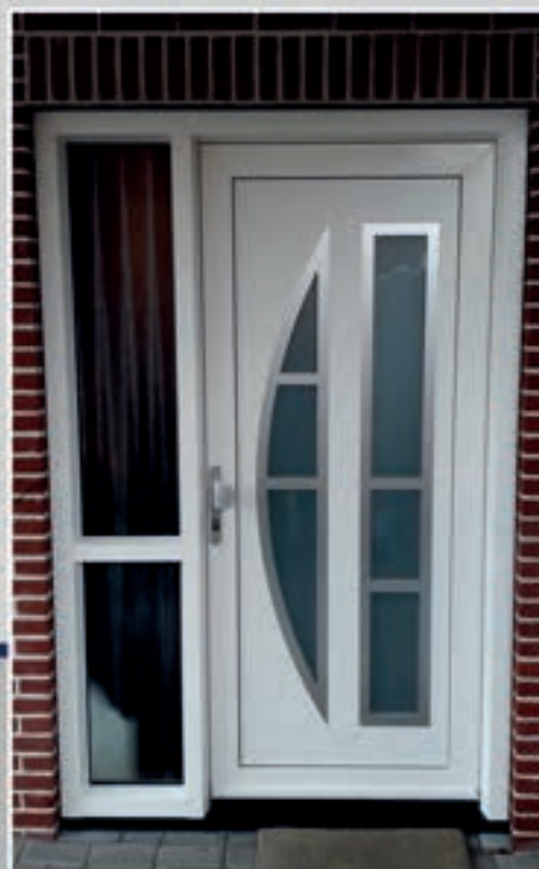
S.23 | Ceylon - Links = Ronde glas van buiten gezien links • Glas: Satinato • Applicaties en ornament in Alunox-RVS-look • Ook uitvoerbaar als S.23 | Ceylon - rechts