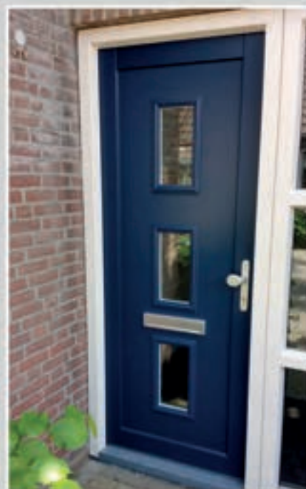
K.41 | Campanula • Glas: Helder