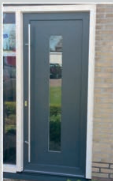
T.08 | Iberis • Glas: Helder • Glas ingefreesd