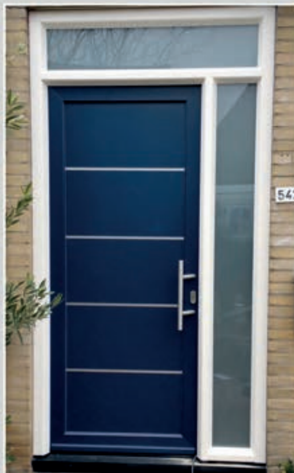
S.29 | Terno • Dicht model • Applicaties in Alunox-RVS-look aan de buitenzijde