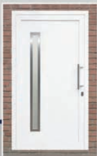
S.11 | Maya - links • Ook uitvoerbaar in: S.11 | Maya - rechts S.11 | Maya - midden • Glas: Satinato • Ornament in Alunox-RVS-look