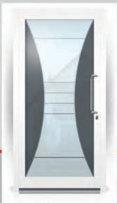
G.903 | Panorama • In 2 tinten gezandstraald glas met heldere motieven