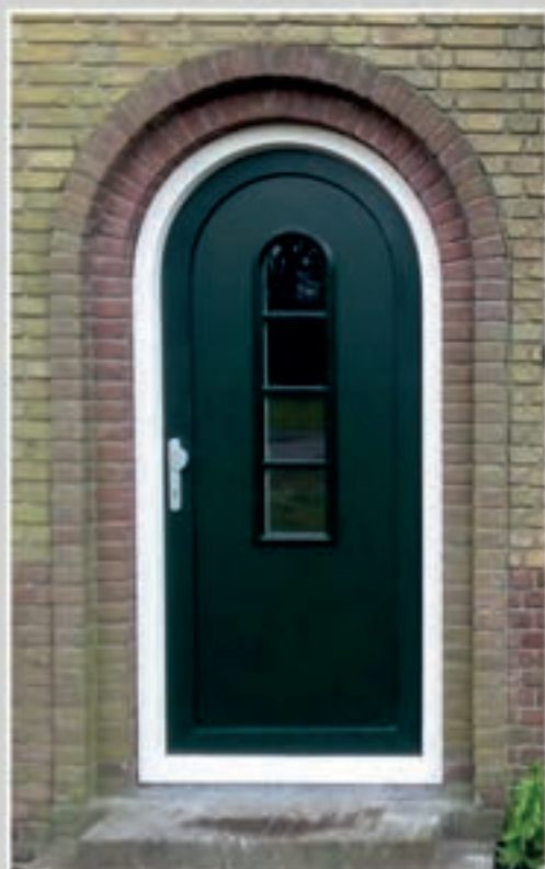
K.37 | Lavendula II