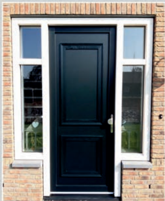
K.58 | Rubin gesloten