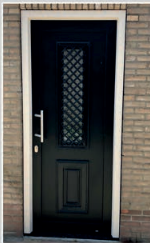
K.98 | Lillum met sierrooster