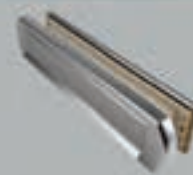
Brievenbus DDD II (Ami)