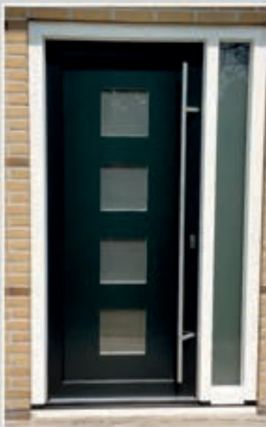
T.01 | Canarina