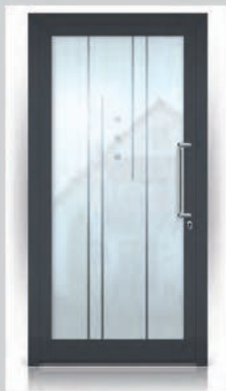
G.902 | Dolce • Gezandstraald glas met heldere motieven