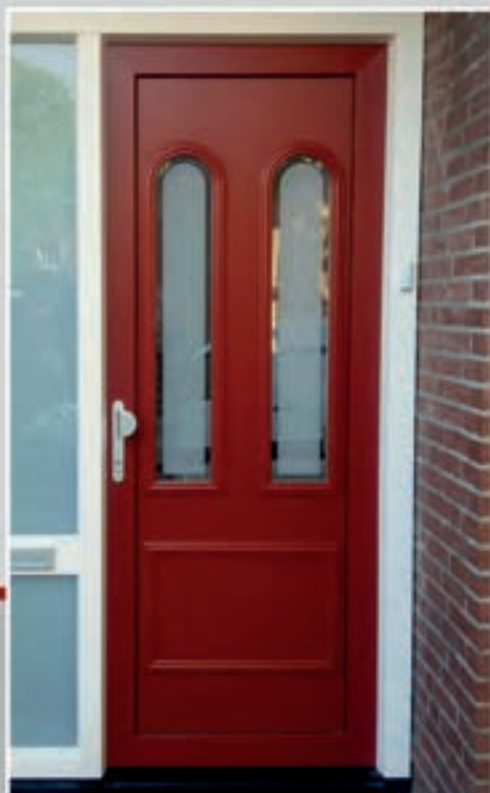
K.34 | Gerbera I