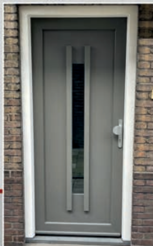
K.160 | Amni