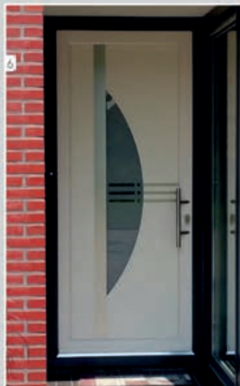
S.21 | Kurkuma III • Matglas met heldere strepen en blokjes • Glas ingefreesd • Applicaties in Alunox-RVS-look