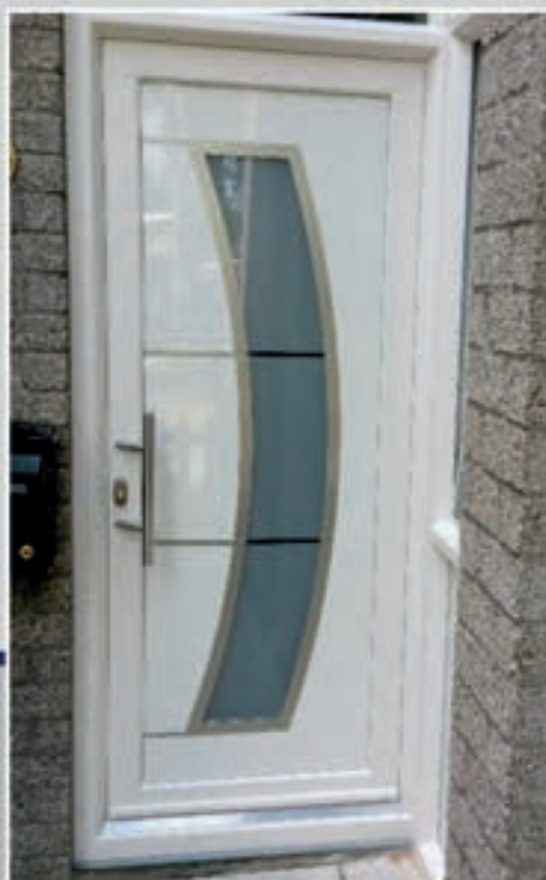
S.22 | Boge II • Matglas met heldere strepen • Applicaties en ornament in Alunox-RVS-look