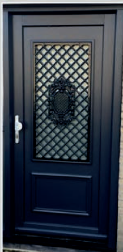
K.48 | Maranta met Sierrooster