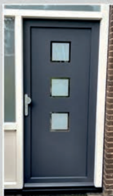
T.182 | Canela II • Glas: Satinato • Glas: Matglas met heldere rand = meerprijs