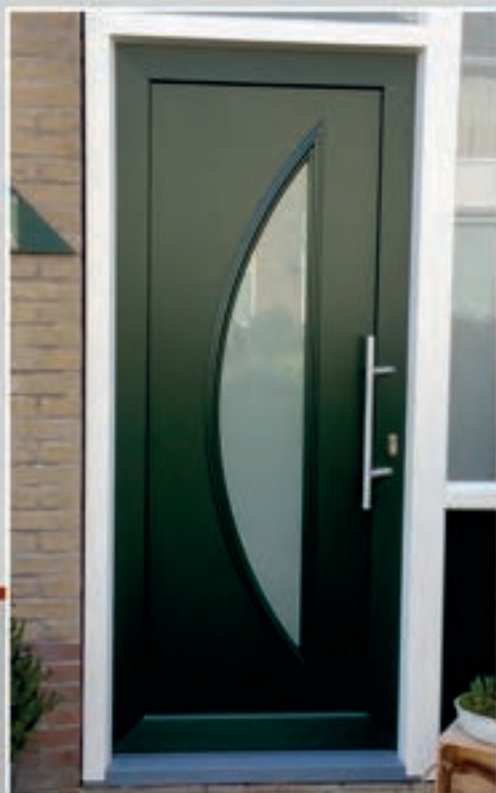
K.44 | Kurkuma • Glas: Satinato