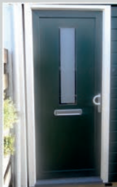
T.88 | Calluna • Glas: Matglas met heldere rand = meerprijs