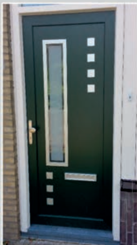
S.15 | Iris - links • Matglas met heldere rand = meerprijs • Applicaties en ornament in Alunox-RVS-lock • Ook uitvoerbaar in S.15 | Iris - rechts