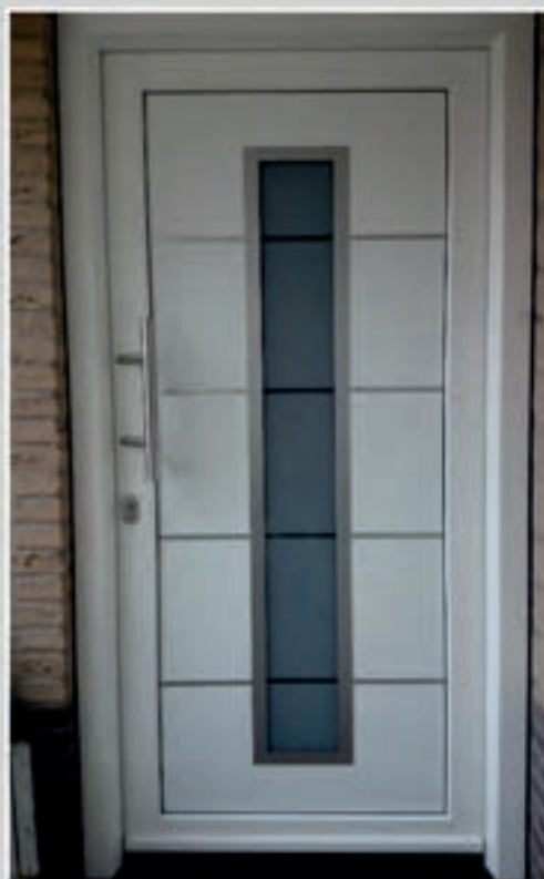
S.10 | Iberis III • Inclusief matglas met heldere strepen • Applicaties en ornament in Alunox-RVS-look