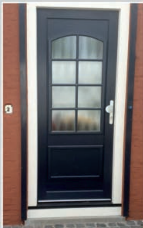
K.206 | Viola