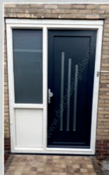
T.93 | Orgel - links