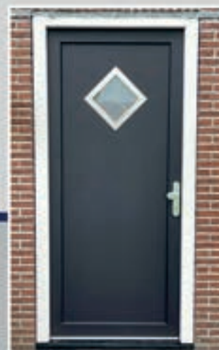
S.28 | Trientalls • Glas: Satinato • Ornament in Alunox-RVS-look