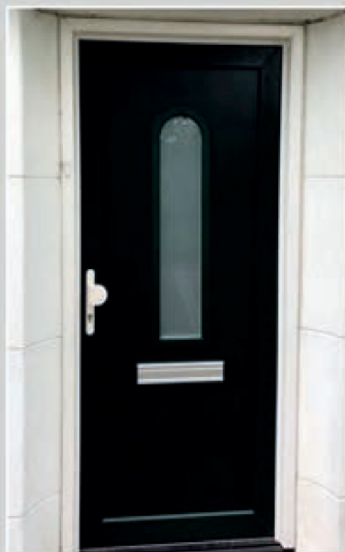
K.38 | Lavendula